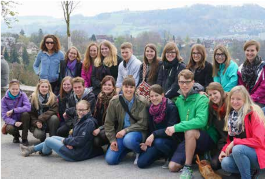
Gruppen-Foto IVSA Bern, Dänemark und Zürich

wir freudig dem Gegenbesuch im August 2015 entgegenblickten.