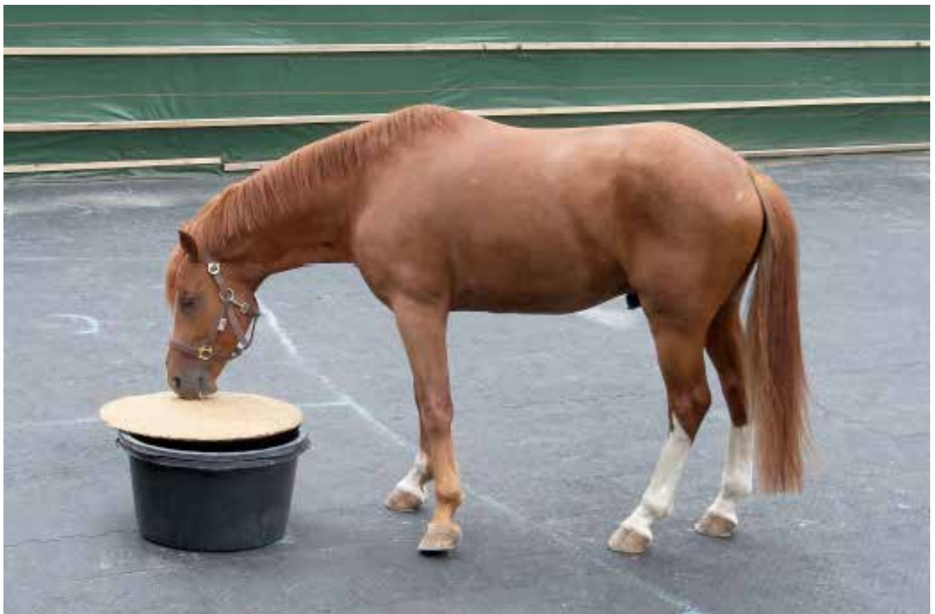
Pferd geht zum Eimer in Erwartung einer Futterbelohnung.

dass wir auf indirekte Indikatoren angewiesen sind, die uns Aufschluss über die Emotionen von Tieren geben. Die Identifizierung solcher Indikatoren ist eine der Aufgaben der Abteilung Tierschutz.