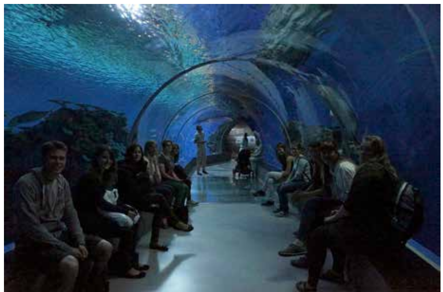
Besuch im Blue Planet-Aquarium in Kopenhagen

Alles in allem können wir auf eine spannende Zeit mit unseren dänischen Freunden zurückblicken, die geprägt war durch veterinärmedizinische, kulturelle und kulinarische Eindrücke in zwei verschiedenen Ländern.