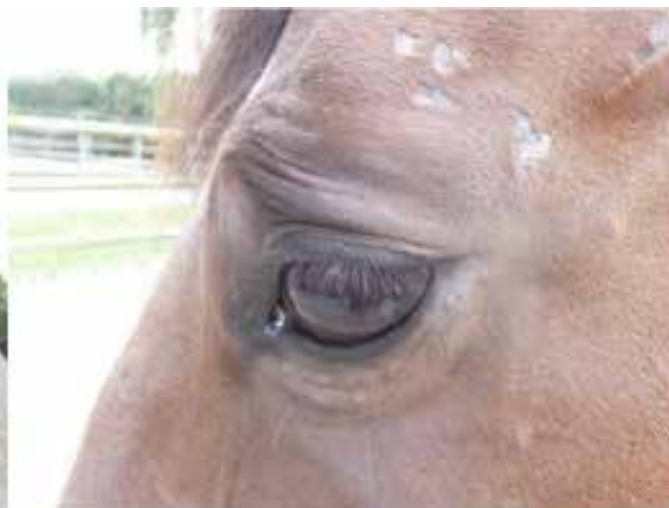
Pferd mit stark ausgeprägten Augenfalten, die einen spitzen Winkel bilden.

Zur Beurteilung von Emotionen wird auf eine Kombination von Indikatoren des Verhaltens und der Physiologie sowie auf kognitive Parameter zurückgegriffen. In meiner Doktorarbeit konzentrieren wir uns auf Aspekte des Verhaltens und der Kognition (Informationsverarbeitung, Treffen von Entscheidungen) zur Beurteilung von Emotionen bei Pferden. Für den kognitiven Ansatz gehen wir von der sprichwörtlichen Frage aus, ob ein halb gefülltes Glas als halbvoll oder als halbleer empfunden wird. Aus human-psychologischen Studien wissen wir, dass positiv gestimmte Menschen das Glas eher als halbvoll empfinden, während Patienten mit depressiven Verstimmungen es eher als halbleer bezeichnen.