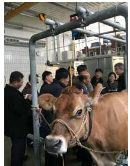
Jersey Kuh im Untersuchungsstand.