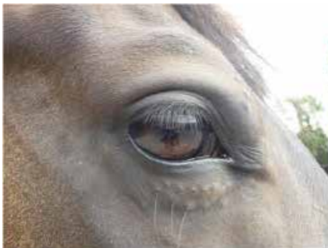
Pferd mit minimal ausgebildeten Augenfalten.