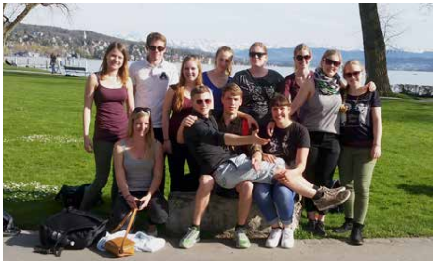
Gruppen-Foto IVSA Dänemark und Zürich

Durch gemeinsame Abendessen, Spielerunden und interessante Gespräche sind wir uns schnell freundschaftlich näher gekommen, so dass